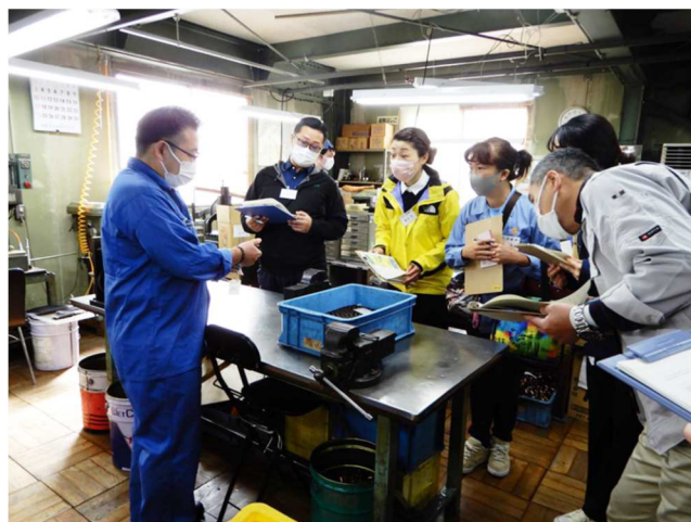
昨年10月東京労働安全衛生学校の職場巡視風景から。 現場ならではの改善事例があなたの職場改善へのひらめきにつながります