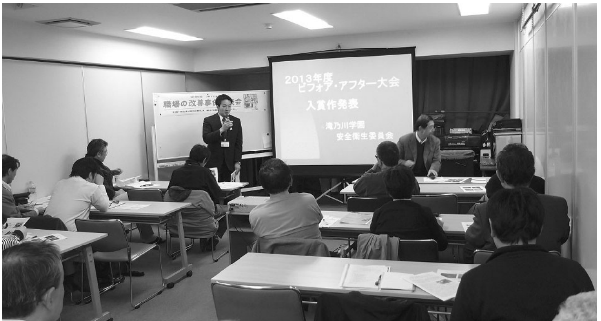
【職場改善事例発表会で、知的障害者施設での改善成果を発表する。2013年4月19日】